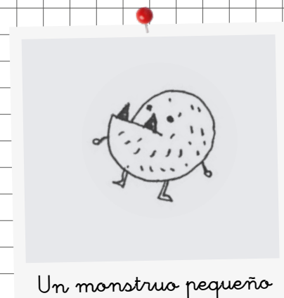
Un monstruo pequeño