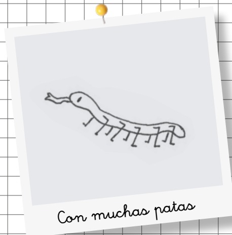
Con muchas patas