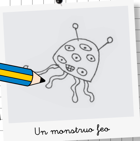
Un monstruo feo